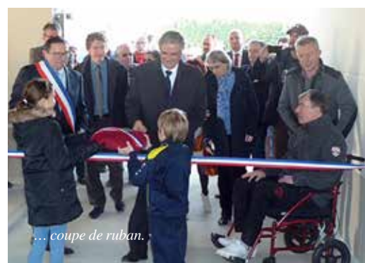
... coupe de ruban.