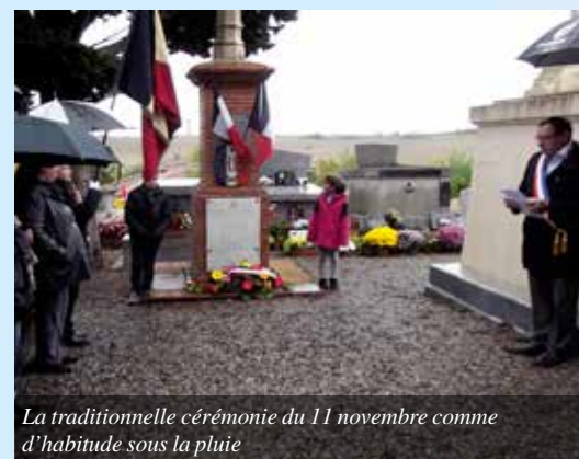
La traditionnelle cérémonie du 11 novembre comme d'habitude sous la pluie