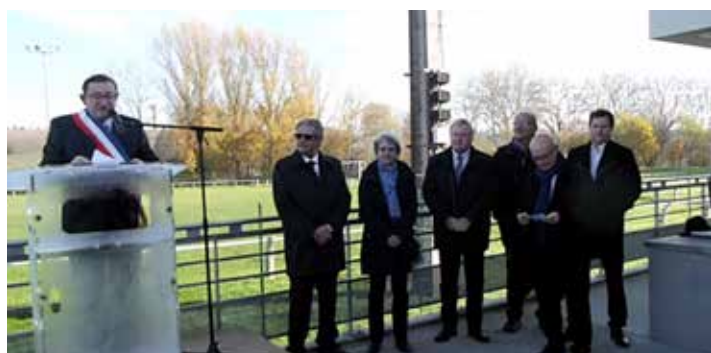
Le discours de M. le Maire