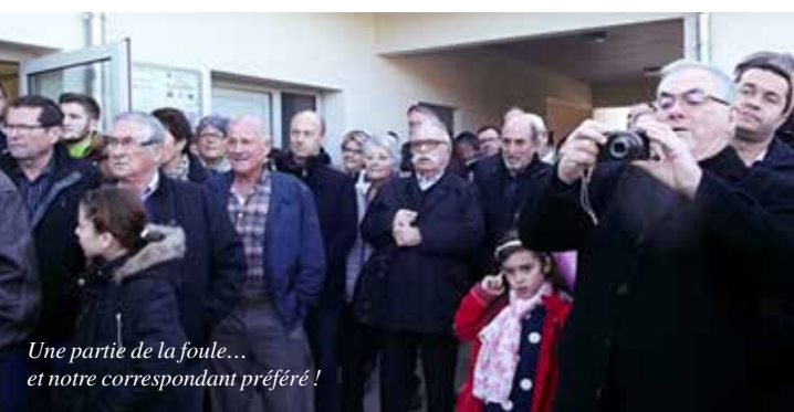
Une partie de la foule... et notre correspondant préféré !